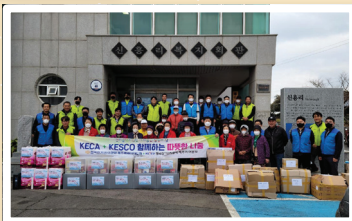
한국전력 어촌계 생활물품 지원