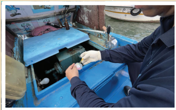
해양환경공단 소형선박 수리